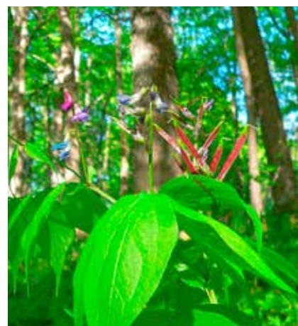
Vänärt i Årvidsnäs.